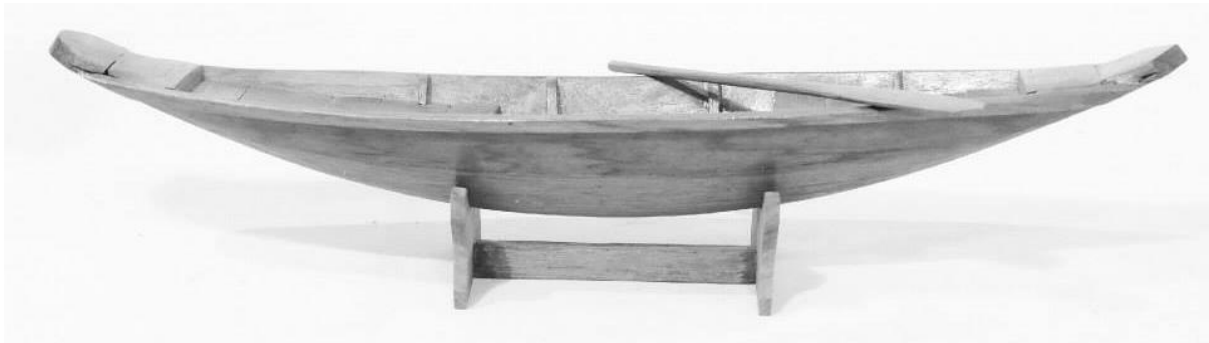
เรืออีแปะ

เหล่านี้มีรูปแบบที่เพรียวทรงตัวยาก หากทรงตัวไม่ดีเรือจะพลิกคว่ำได้ง่าย เรือประเภทนี้จึงเป็นเครื่องมือฝึกสติและสมาธิของพระภิกษุเป็นอย่างดี