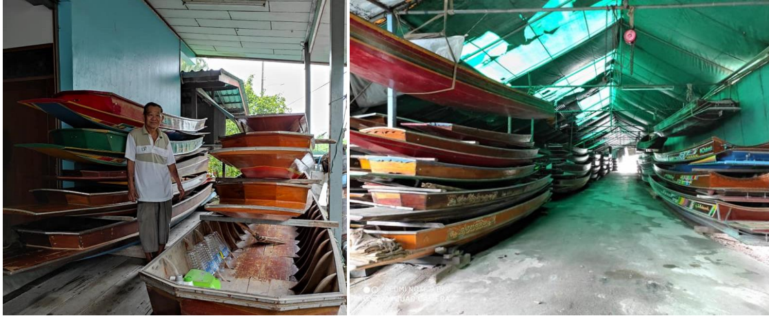
แพตายนัน หรือร้านค้าเสรีโชค โกดังเก็บเรือ