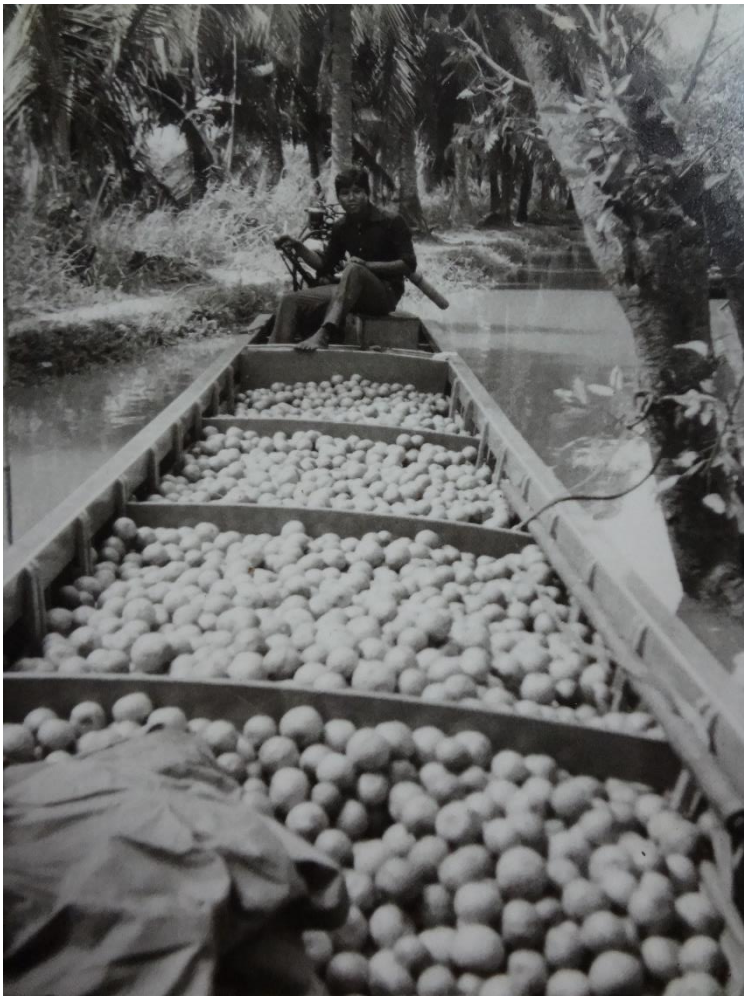
เรืออีซูซุ เรือหางยาว ๑๔ วา ติดเครื่องอีซูซุ

ในย่านคลองบางมดเครื่องยนต์เรือเป็นที่นิยมตั้งแต่วราว พ.ศ. ๒๕๑๐ เรือเครื่องในคลองบางมดพอดีกับยุคเฟื่องฟูของสวนส้มบางมด เครื่องเรือเหล่านี้ที่ได้ก่อให้เกิดคลื่นขนาดใหญ่และคลื่นกระแทกแรง จากคำบอกเล่าชุมชน เมื่อคลื่นซัดฝั่งมาจนเขาเขาดิ่ง แนวลำประโดงเก่า ตลิ่งพังทำให้คลองกว้างขึ้น คลองบางมดเป็นคลองหลัก “ทุก ๆ คน ต้องเล่นผ่านไปทำสวน” คนทำสวนต้องวิ่งผ่านคือ คลองหน้าวัดพุทธบูชาไปผ่านมัสยิด ผ่านไปทางแถววัดบัวผัน คลองรางแม่น้ำ “ตลิ่งพังออกไปเสียหายมากจนคลองกว้างขึ้น” จนกระทั่งไปออกคลองรางยายเพียร “ใครทำสวนก็ขุดคลองไป” คลองซอยไม่กว้างนัก เพราะเหมือนเป็นคลองส่วนบุคคลตั้งน้ำเข้าสวน