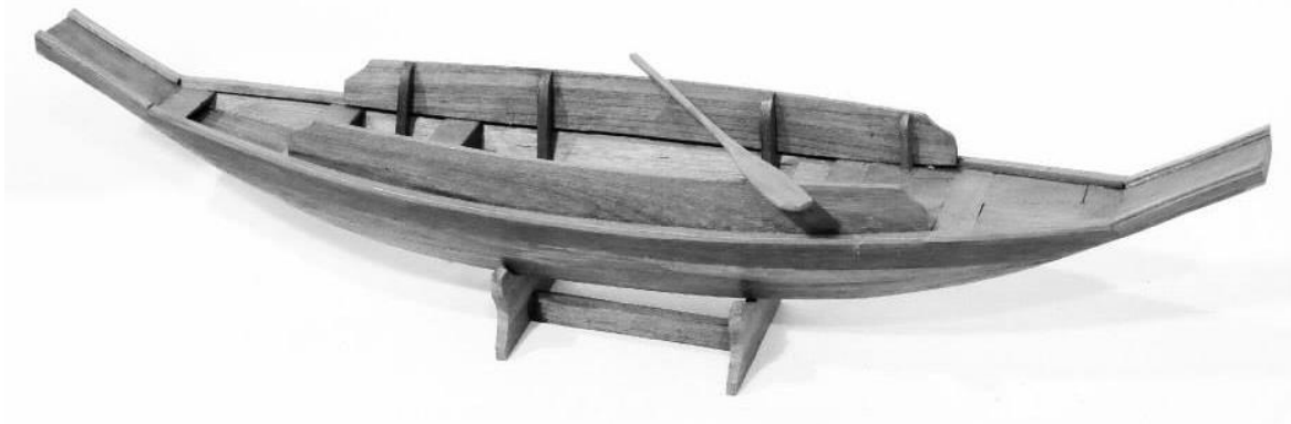
เรือสำปั้นสวน