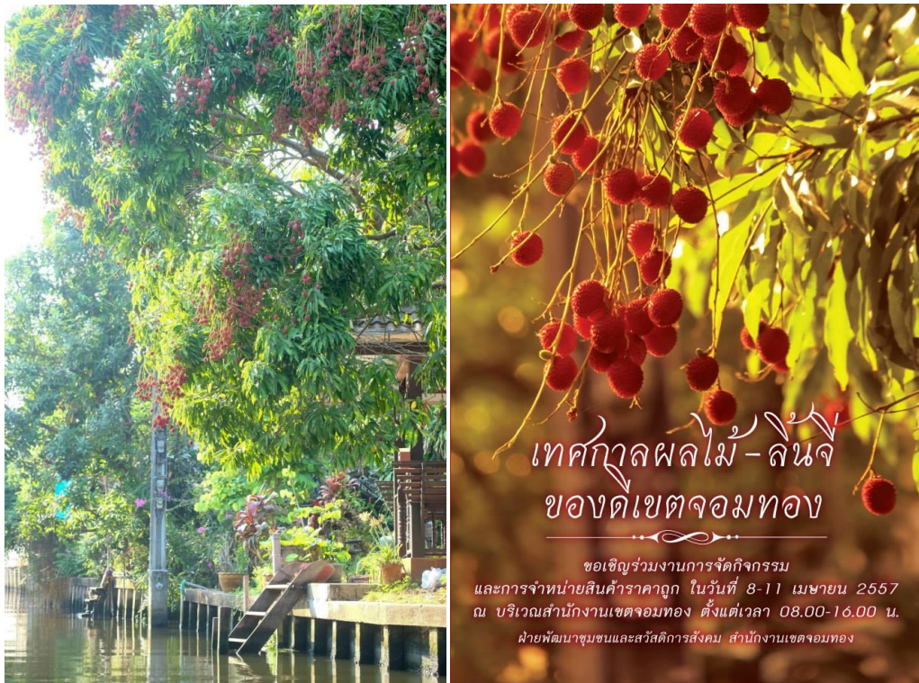
สวนลื่นจี จอมทอง

คลองบางขุนเทียน มีเส้นทางจากทิศเหนือลงใต้ แยกจากคลองด่านและคลองสนามชัย มีคลองตัดแยกจากคลองบางขุนเทียน เช่น คลองดาวคะนอง คลองลัดเซ็ดหน้า เป็นต้น ไปจรดคลองตรงและคลองบางมด เป็นพื้นที่สวนลื่นจีดั้งเดิม บริเวณสามแยกคลองบางขุนเทียนและคลองดาวคะนอง เรียกว่า แยกคู้งลื่นจี หรือสามง่าม เมื่อสมัยกรุงศรีอยุธยาตอนปลาย เกิดชุมชนบริเวณคลองบางขุนเทียน ดังปรากฏการสร้างวัดยมโลก (บางขุนเทียนนอก) พ.ศ. ๒๒๕๖ วัดบางขุนเทียนกลาง พ.ศ. ๒๓๐๐ และวัดขุนน (บางขุนเทียนใน) พ.ศ. ๒๓๐๐