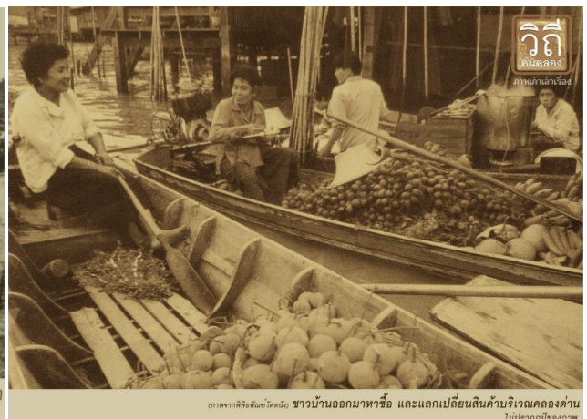
ภาพจากพิพิธภัณฑ์เมือง ชาวบ้านออกมาหาซื้อ และแลกเปลี่ยนสินค้าบริเวณคลองด่าน ไม่ปรากฏปีของภาพ

ชาวบ้านออกมาหาซื้อและแลกเปลี่ยนสินค้าในคลองด่าน