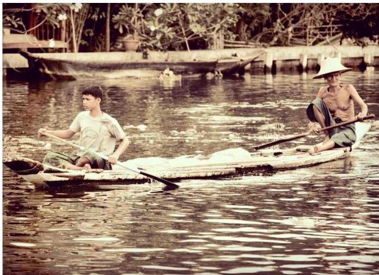
คลองสนามไชย บางกระบือ

แยกจากคลองสนามชัยด้านอนุสาวรีย์คุณกะลาไปทางทิศใต้ เป็นคลองหัวกระบือ หรือคลองขุนราชพินิจใจ เป็นคลองขุดตรงไปออกชายทะเลบางขุนเทียน เป็นพื้นที่ชุ่มน้ำจืด มีต้นปรี๊ด จาก ตีนเป็ด ต้นปรัง เตยหนาม ต้นกระถิน ตะขบ ตลอดจนถึงท้องนา และพื้นที่สวน จนค่อย ๆ เปลี่ยนเป็นพื้นที่น้ำกร่อยและป่าชายเลน แต่ดั้งเดิมมีการตั้งถิ่นฐานที่ชุมชนวัดศีร์ษะกระบือ (วัดหัวกระบือในปัจจุบัน) ตั้งแต่สมัยกรุงศรีอยุธยาตอนปลาย