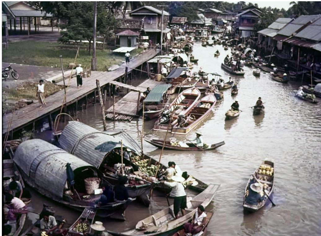
ตลาดน้ำวัดไทร