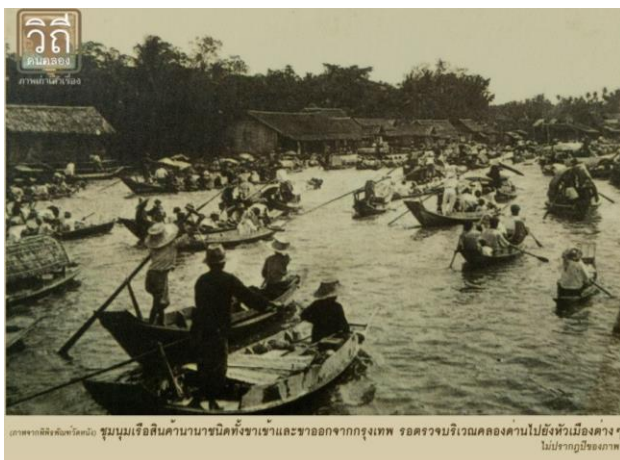
ชุมชนเรือสินค้านานาชาติทั้งชาและชาวออกจากรุงเทพ ขอตรวจบริเวณคลองด่านไปยังหัวเมืองต่างๆ ไม่ปรากฏชื่อภาพ ไม่ปรากฏปีของภาพ

ถัดมาคลองด่าน มีชุมชนเก่าแก่ซึ่งปรากฏชื่อในกำสรวลสมุทร คือชุมชน “บางนางนอง” นอกจากนี้ยังปรากฏชุมชนสมัยอยุธยาตอนต้น ฝั่งตรงข้ามคลองคือ ชุมชนวัดจอมทอง คาดว่าชุมชนย่านนี้มีสภาพเป็นย่านตลาด ย่านสวนยกท้องร่องปนกับท้องนา ในสมัยต่อ ๆ มาได้ขยายชุมชนต่อเนื่องตามเส้นทางคลองด่าน - คลองสนามชัย เช่น ชุมชนที่วัดหนัง วัดไทร วัดสิงห์ วัดกก วัดเลา เป็นต้น